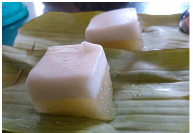
8. ขนมตะโก้มันสำปะหลัง