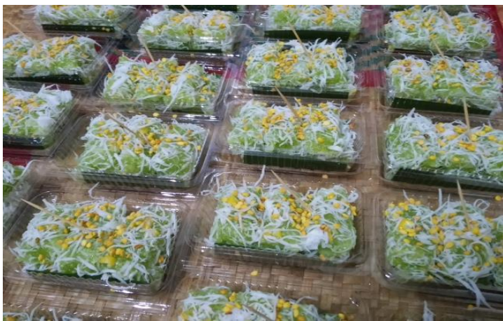
5. ขนมหยกมณี