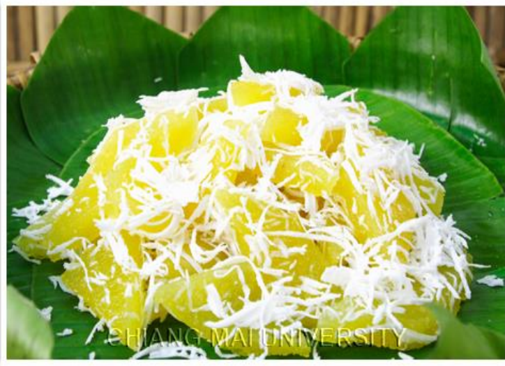
9.ขนมมันสำปะหลัง