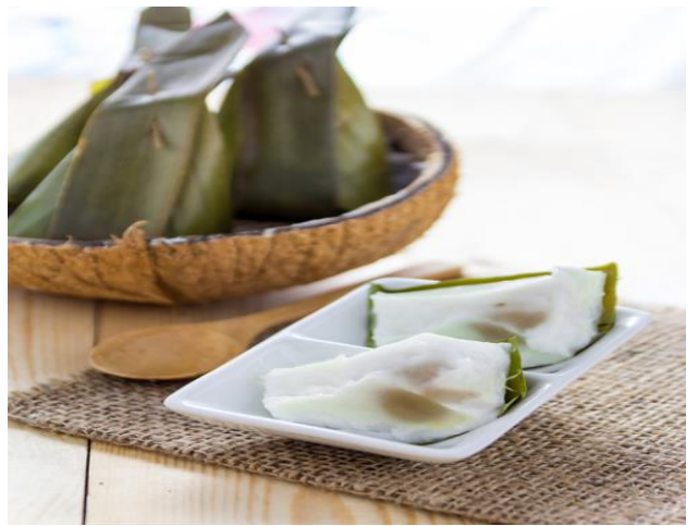
2. ขนมใส่ไส้