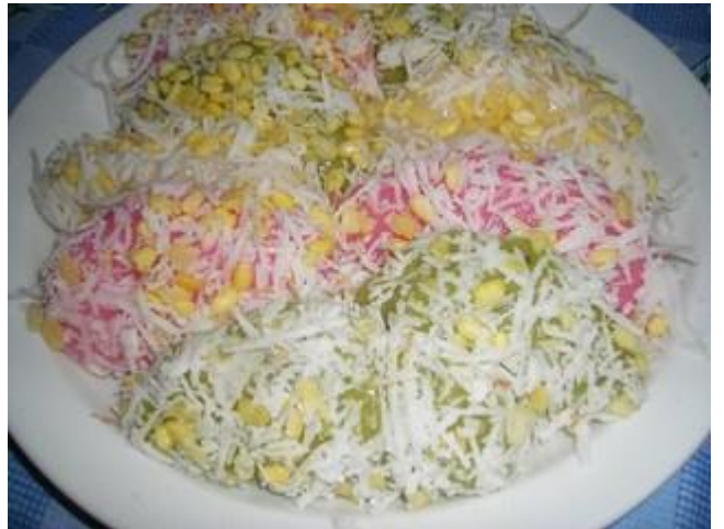
4. ขนมถั่วแปบ