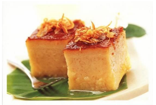
12.ขนมหม้อแกง