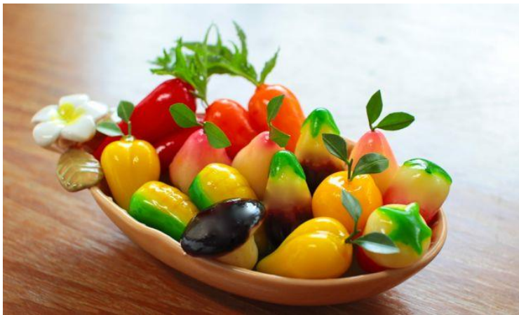
11.ขนมลูกชุบ