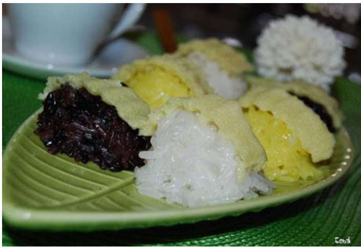
1. ข้าวเหนียวสังขยา