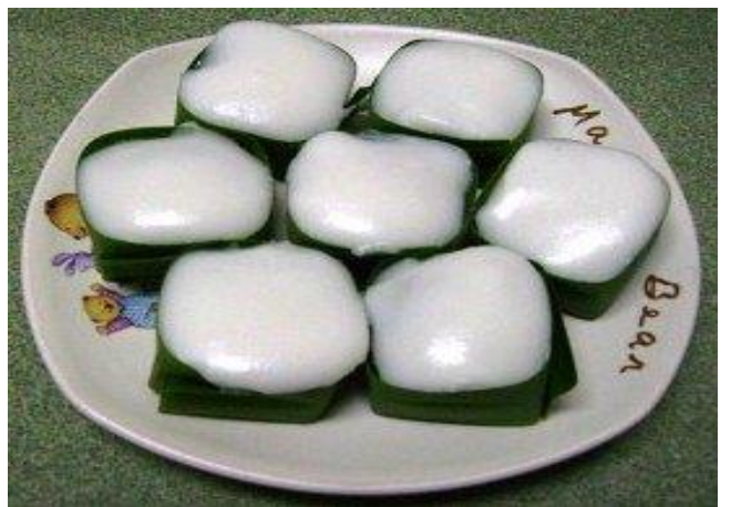
6. ขนมตะโก้เผือก