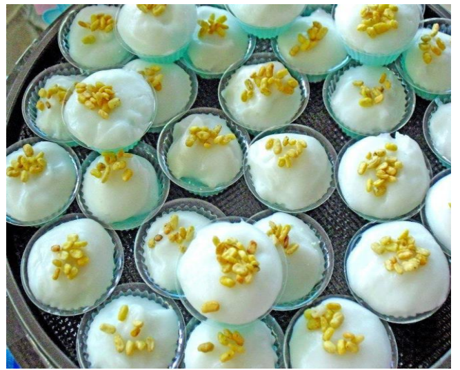
10.ขนมลืมกิ้น