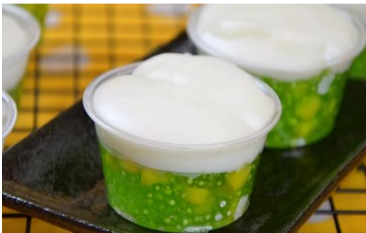
7. ขนมตะโก้สำดู