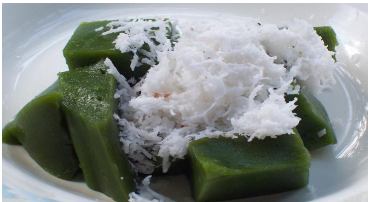
13.ขนมเปียกปูน